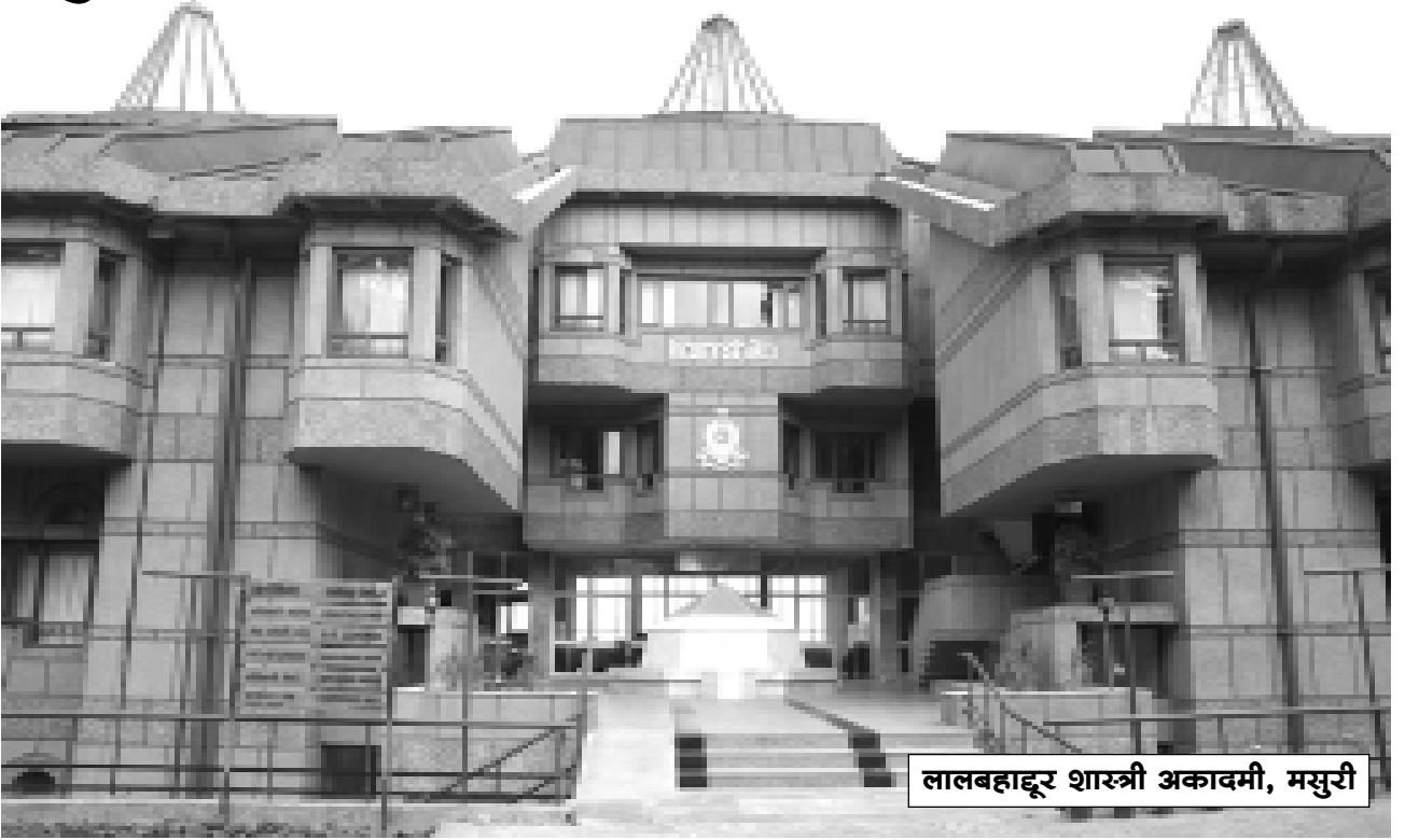
लालबहादूर शास्त्री अकादमी, मसुरी

भा रतीय प्रशासन सेवा (भा.प्र.से.)च्या खांद्याला खांदा लावून संयुक्त सचिव या पदावर थेट नियुक्ती हा भारत सरकारचा एक महत्त्वाचा व आशादायक निर्णय आहे. आज आपल्या सामान्य लोकांचे प्रश्न - उदा., रस्ते, वीज, पाणी, शहरी प्रदूषण व गावांमधील बकाली, आदिवासी समाजात कुपोषण या सगळ्याच समस्या अधिक गंभीर झाल्या आहेत व ह्याला काही अंशी जबाबदार आहे बिघडलेले प्रशासन. आजची थेट नियुक्ती ही जरी केंद्र सरकारच्या काही मोजक्या विभागांसाठी सीमित असली, तरी अशा प्रशासकीय सुधारणा या विकासाच्या दृष्टीकोनातून बघायला हव्या.